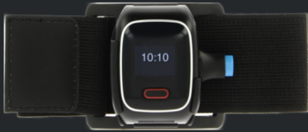
● Kit de brazalete