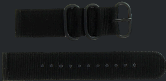
● Pulsera de nylon negra